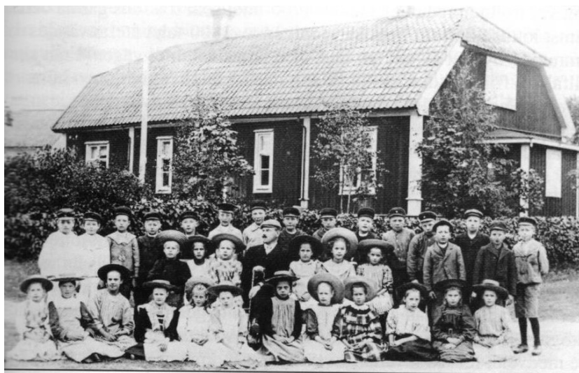
Uppställning framför tingshuset som blev skola.

Historik om verksamheten i de olika skolorna i Tjällmo (såväl centralt som runt om i socknen) finns att läsa i föreningens bok "Tjällmominnen 2".