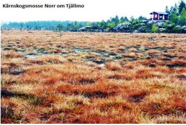
Kärnskogsmosse Norr om Tjällmo