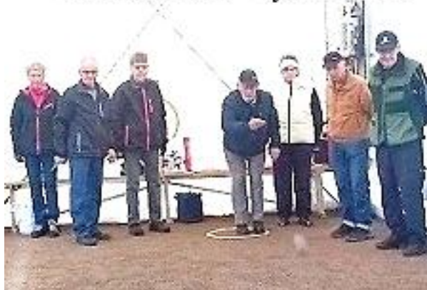
Hällestad PRO Tjällmo MIX